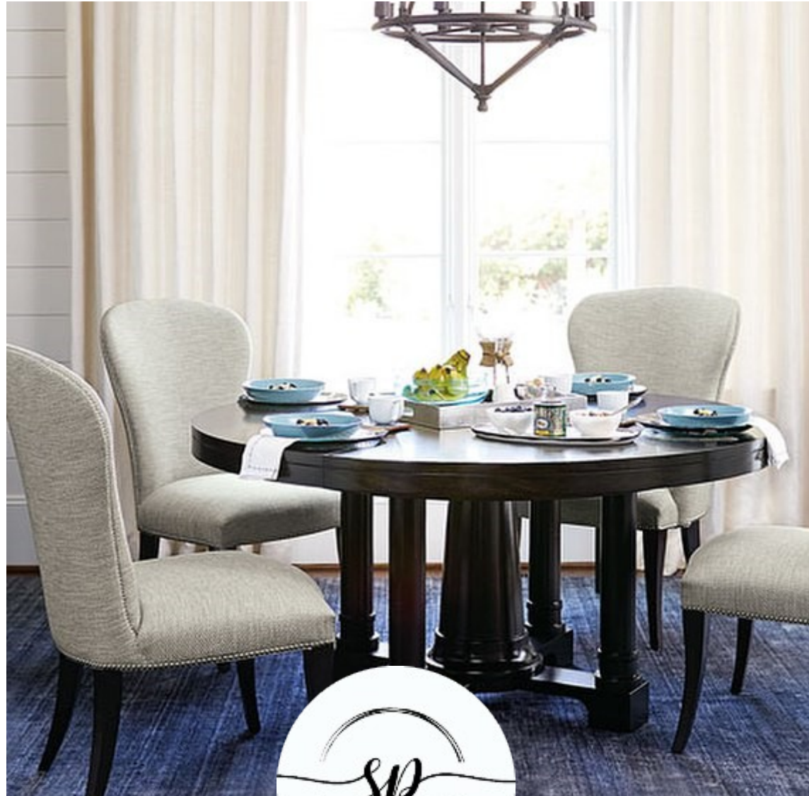
Схема ремонта от А до Я от ателье мебели Soft Place Design